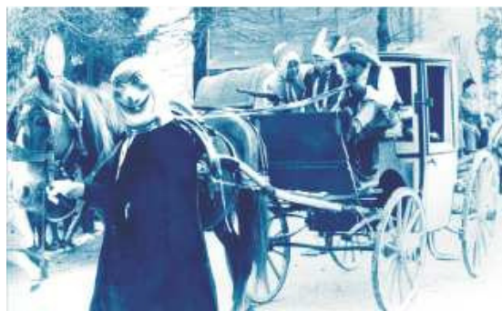
Calesse del Far West - 1963