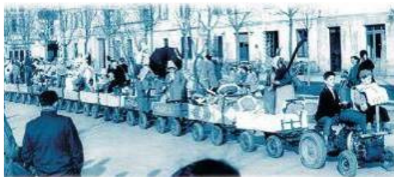
il carro dei 12 mesi - 1957

Non si hanno notizie che a Novi, prima della Grande Guerra (1915/18), si siano svolte manifestazioni di sfilate carnevalesche in costume lungo le vie del nostro paese. Nel periodo di Carnevale è noto invece che fino dai primi anni del Novecento si svolsero i "Veglioni di Carnevale", organizzati dal Patronato Scolastico, che si tenevano presso sale private o le aule delle vecchie scuole elementari in centro paese (il Teatro Sociale ancora non c'era). La Prima Guerra Mondiale e la crisi successiva interruppero ogni velleità carnevalesca,